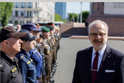
02.07.2023. Valsts prezidents Egils Levits un Andra Levite piedalās XXVII Vispārējo latviešu Dziesmu un XVII Deju svētku dalībnieku gājienā "Novadu dižošanās"