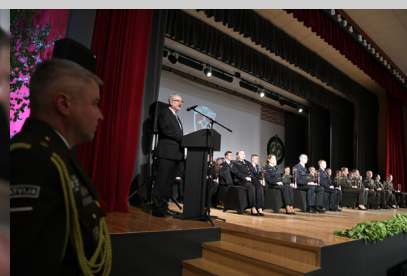
06.06.2023. Valsts prezidenta Egila Levita darba vizīte Slovērijā, dalība NATO Austrumu flanga valstu vadītāju sanāksmē Bratislavā