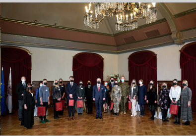
15.02.2022. Debašu cikla "#Satversmei100: vērtības nākotnei" atklāšanas pasākums