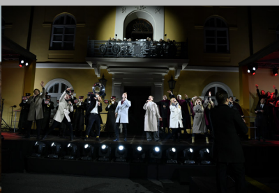
12.11.2022. Koncertstāsts "Savējs. Mūsos pašos" laukumā pie Rīgas pils