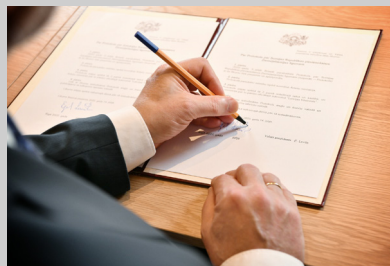
15.07.2022. Likumu par Somijas un Zviedrijas pievienošanos NATO parakstīšana