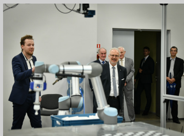
12.07.2022. Elektronikas un datorzinātņu institūta apmeklējums