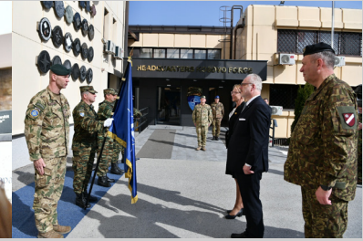
22.04.2022. Latvijas Nacionālais kontingents NATO operācijā Kosovā