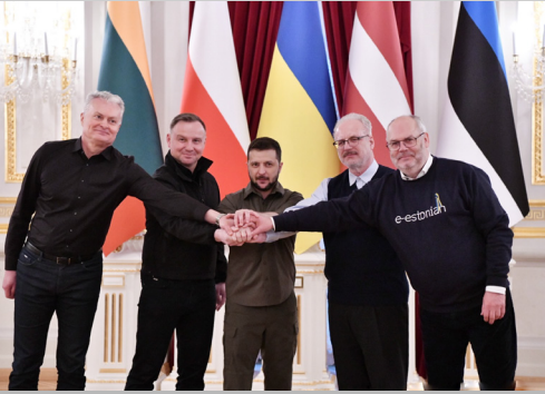
13.04.2022. Latvijas, Lietuvas, Igaunijas un Polijas prezidentu tikšanās ar Ukrainas prezidentu Volodimiru Zelenski Kijivā