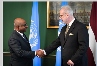
21.07.2022. Tikšanās ar ANO Ģenerālās Asamblejas 76. sesijas prezidentu Abdulu Šahidu