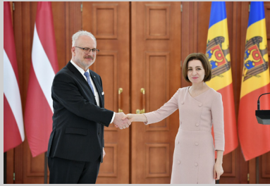
07.04.2022. Tikšanās ar Moldovas prezidenti Maju Sandu Moldovas Republikā

Lai redzētu vairāk fotogrāfiju no norises, klikšķiniet, lūdzu, uz attēla!