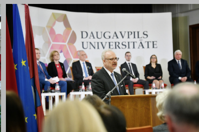
05.04.2022. Diskusija ar Latgales plānošanas reģiona pašvaldību vadītājiem Daugavpils Universitātē