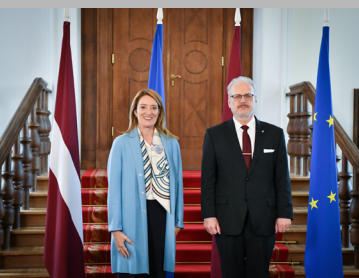
27.10.2022. Tikšanās ar Eiropas Parlamenta priekšsēdētāju Robertu Metsolu