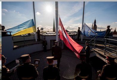
09.05.2022. Latvijas, Ukrainas un Eiropas Savienības karogu pacelšanas ceremonija Rīgas pils Svētā Gara tornī Ukrainas kara upuru piemiņas dienā