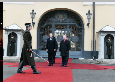
23.11.2022. Rumānijas prezidenta Klausa Vernera Johannisa oficiālā vizīte Latvijā