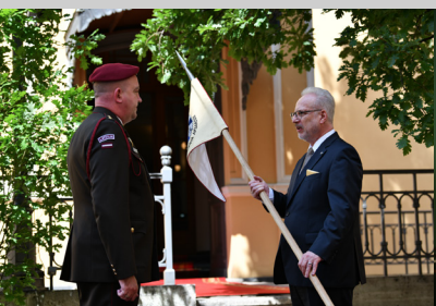
21.07.2022. Valsts prezidents Egils Levits pasniedz Valsts prezidenta apsardzes standartu