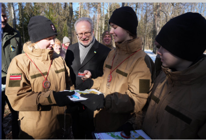
02.03.2022. Balvu un Gulbenes novadu apmeklējums