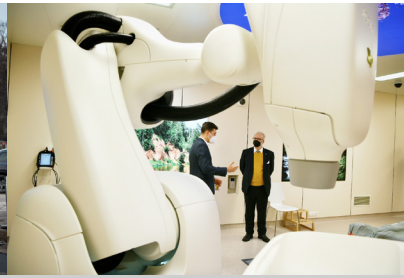
19.01.2022. Siguldas novada apmeklējums