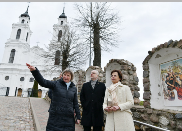
27.04.2022. Valsts prezidents Egils Levits un Andra Levites kundze reģionālās vizītes laikā iepazīstas ar Ludzas pilsētas kultūrvietām