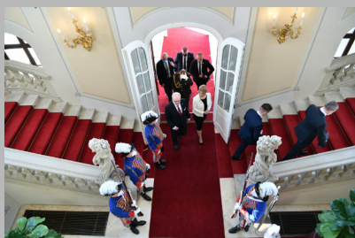
28.03.2022. Valsts prezidenta Egila Levita oficiālā vizīte Slovērijā