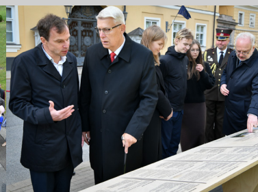
28.09.2022. Pie Rīgas pils atklāj ārtelpas izstādi "Valsts prezidenta institūcijai 100"