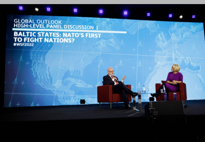
04.10.2022. Dalība Varšavas drošības forumā