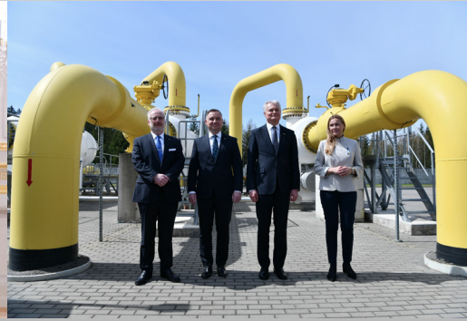
05.05.2022. Polijas-Lietuvas gāzes starpvienojuma atklāšanas ceremonija Lietuvā