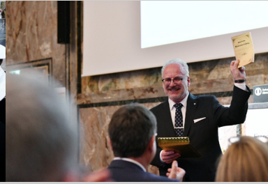
11.04.2022. Valsts prezidents sniedz tā dēvēto Čērčila runu Cīrihes Universitātē