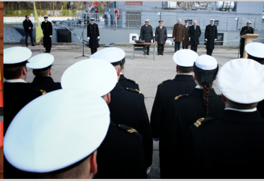
09.04.2022. Jūras spēku Patruļkuģu eskadras karoga svinīgā pasniegšanas ceremonija Liepājā