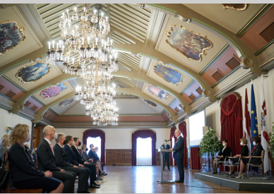
11.02.2022. 11.02.2022. Diskusija "Pavērsiens: 10 gadi kopš valodas referenduma"