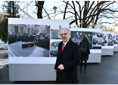
13.01.2022. Izstādes "Atceroties 1991. gada barikādes" apmeklējums

Lai redzētu vairāk fotogrāfiju no norises, klikšķiniet, lūdzu, uz attēla!