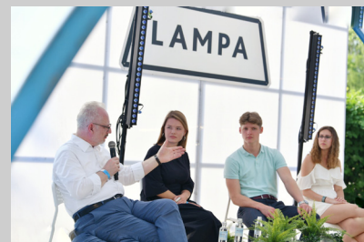
02.07.2022. Diskusija ar jauniešiem "Kā atdzīvīnāt vārdus?" sarunu festivālā LAMPA

Lai redzētu vairāk fotogrāfiju no norises, klikšķiniet, lūdzu, uz attēla!