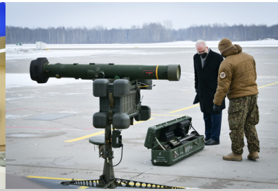
04.02.2022. Nacionālo bruņoto spēku Aviācijas bāzes Lielvārdē apmeklējums