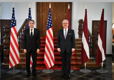
07.03.2022. Tikšanās ar ASV valsts sekretāru Entoniju Blinkenu