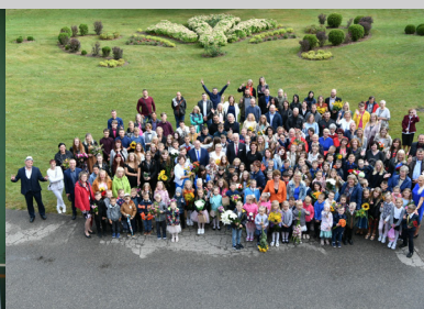
01.09.2022. Zinību diena Vilces pamatskolā