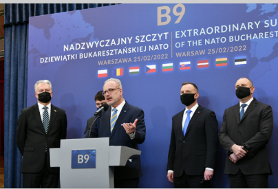
25.02.2022. NATO Austrumu flanga (B9 – Bukarestes devītnieka) valstu vadītāju ārkārtas sanāksme Varšavā