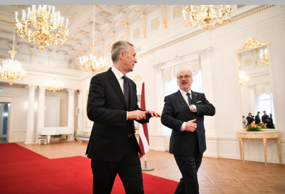
08.03.2022. Tikšanās ar NATO ģenerālsekretāru Jensu Stoltenbergu