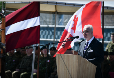
15.06.2022. NATO paplašinātās klātbūtnes kaujas grupas Latvijā 5. gadadiena Ādažu militārajā bāzē