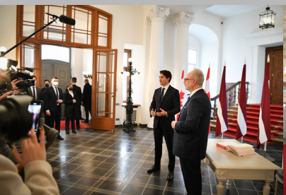
08.03.2022. Tikšanās ar Kanādas premjerministru Džastinu Trudo