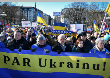
05.03.2022. Atbalsta gājiens Rīgā "Kopā par Ukrainu! Kopā pret Putinu!"