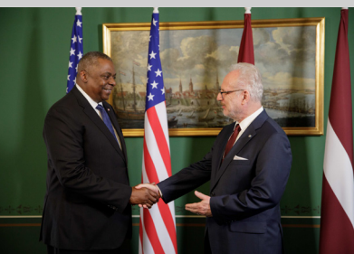
10.08.2022. Tikšanās ar ASV aizsardzības sekretāru Loidu Ostinu