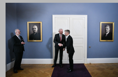
14.11.2022. Valsts prezidenta vietas izpildītāju Paula Kalniņa un Jāzepa Rancāna portretu atklāšana