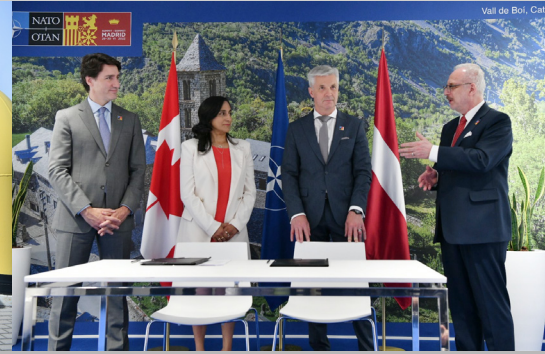
29.06.2022. NATO valstu un valdību vadītāju samits Madridē