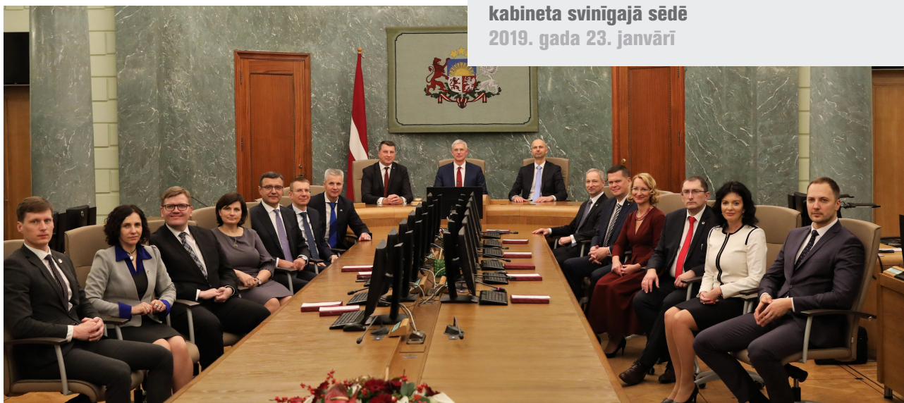
Valsts prezidenta dalība jaunā Ministru kabineta svinīgajā sēdē 2019. gada 23. janvārī