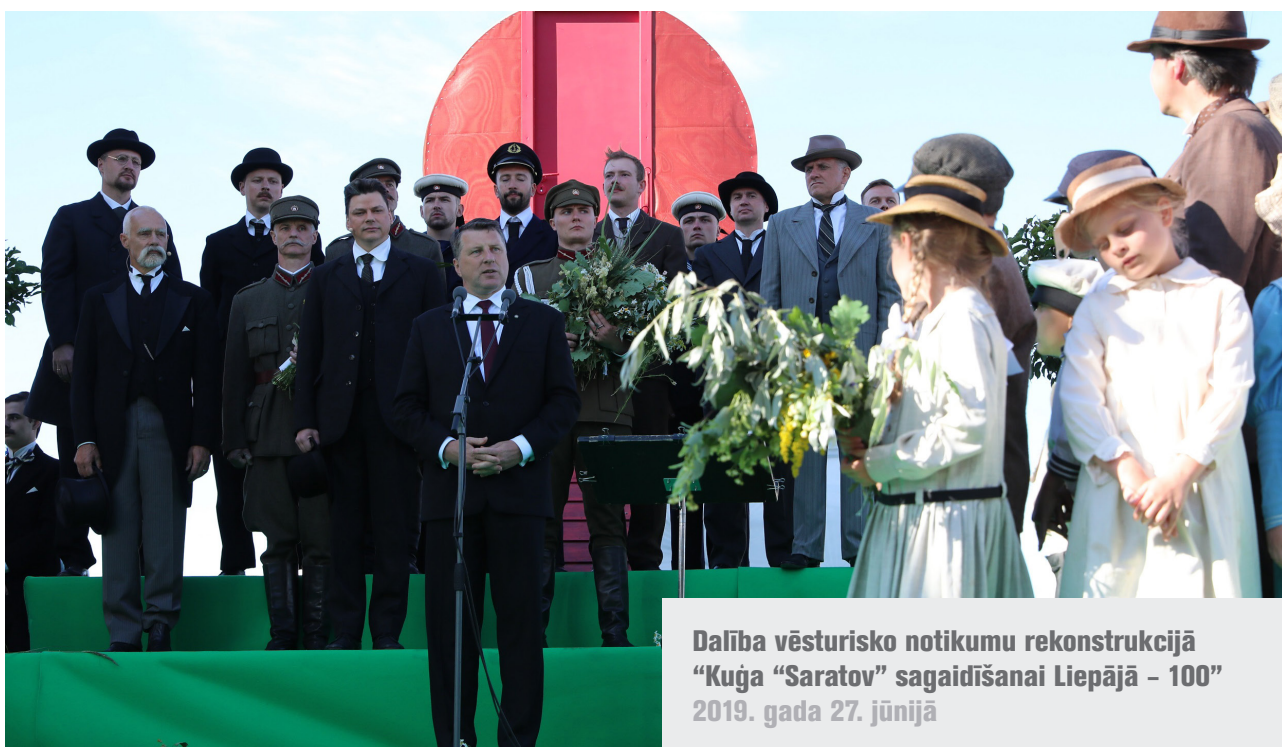
Dalība vēsturisko notikumu rekonstrukcijā "Kuģa "Saratov" sagaidīšanai Liepājā - 100" 2019. gada 27. jūnijā