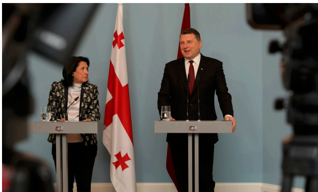
Latviju oficiālā vizītē apmeklē Gruzijas prezidente Salome Zurabišvili 2019. gada 15. maijā