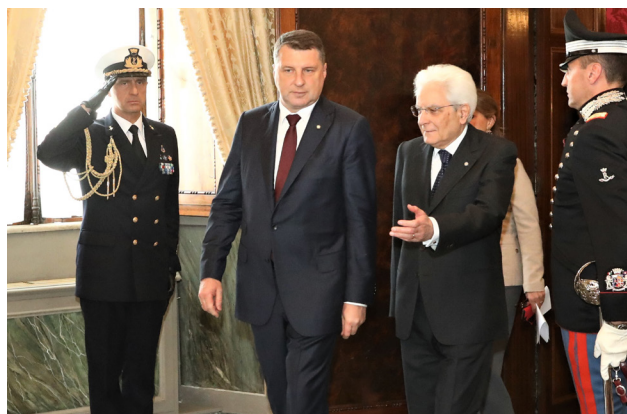
Valsts prezidenta oficiālā sagaidīšanas ceremonija Itālijas prezidenta Serdžo Matarellas rezidencē 2019. gada 24. aprīlī Romā