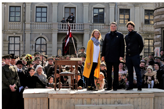
Tikšanās ar filmas "Dvēseļu putenis" veidotājiem 2019. gada 6. aprīlī