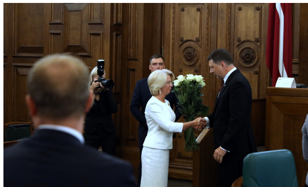
Valsts prezidenta uzruna 13. Saeimas pavasara sesijas pēdējā plenārsēdē 2019. gada 20. jūnijā