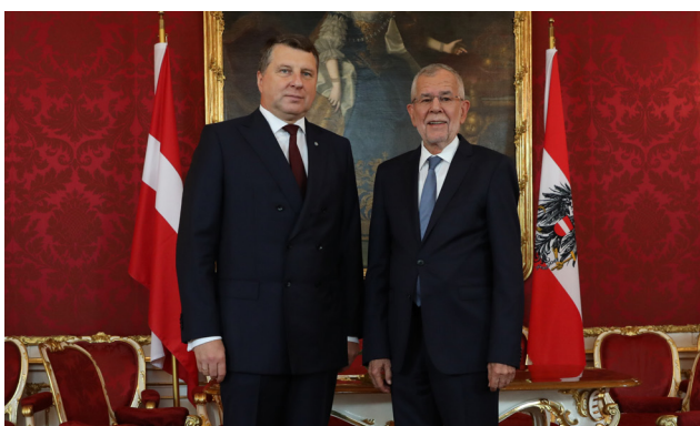
Tikšanās ar Austrijas prezidentu Aleksandru van der Bellenu 2019. gada 27. maijā, Vīnē