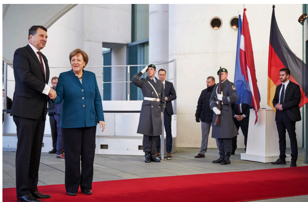
Valsts prezidenta tikšanās ar Vācijas Federālo kancleri Angelu Merkeli valsts vizītes Vācijas Federatīvajā Republikā laikā 2019. gada 22. februārī Berlīnē