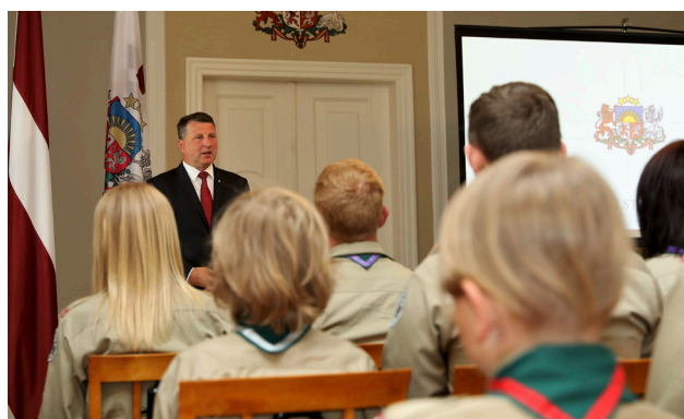
Valsts prezidenta tikšanās ar Latvijas Skautu un gaidu vienībām Rīgas pili 2019. gada 26. jūnijā