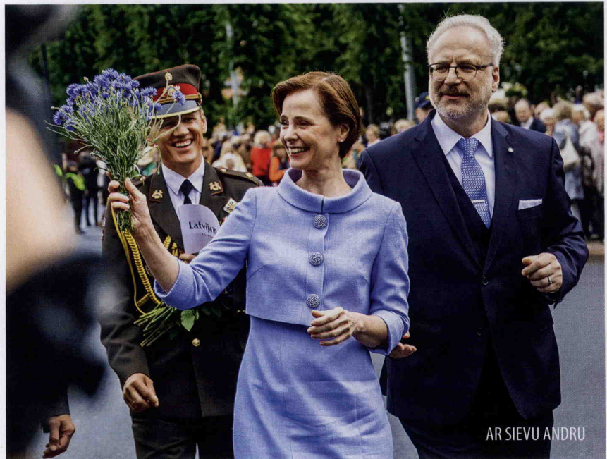
AR SIEVU ANDRU

O, kāds negaidīts jautājums... Iznāks, ka es sevi lielīšu.